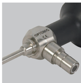
CUERPO DE ACERO INOXIDABLE