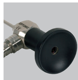
OCULAR DE PEEK