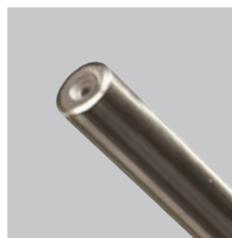
LENTES DE ZAFIRO DE ALTA RESISTENCIA